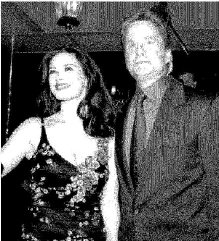
Catherina Zeta-Jones krijgt 1,7 miljoen euro voor elk jaar dat ze het met Michael Douglas volhoudt.